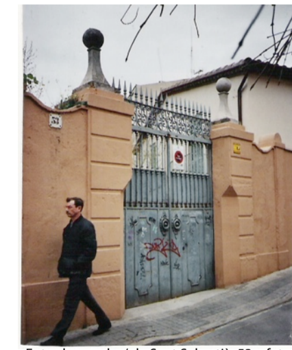
Entrada per el c/.de Sant Sebastià .53 - foto jexposito 2004

La masia va arribar a tenir la teulada totalment malmesa pel pas del temps, i a causa d'unes pluges severes va arribar quasi a l'ensorrament total; sortosament els propietaris varen fer-hi una molt correcta restauració.