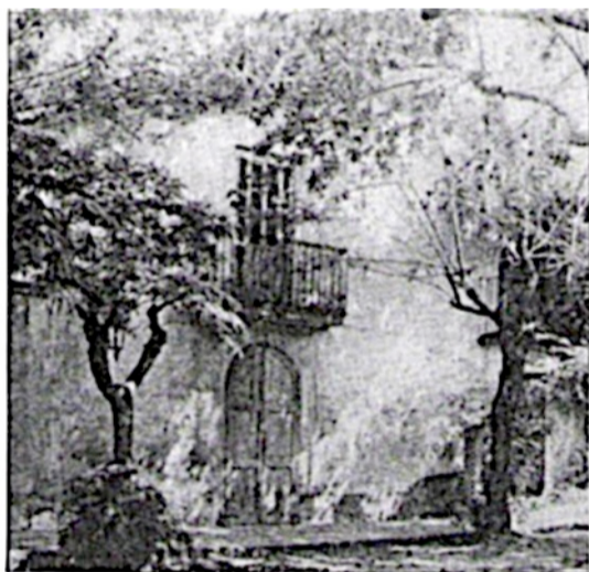
Façana de la Masia al 1930

La masia de Can Casals o Can Casas esta situada a la cantonada del c/ de Barcelona amb Sant Sebastià, al nº 53 ( abans nº9 ). Fou construïda al segle XVIII com un Mas tradicional dins Dalt de la Vila, i un temps després li foren afegides dues petites cases en filera. El propietari era de Tiana, qui més tard la vengué a un prevere de Barcelona.