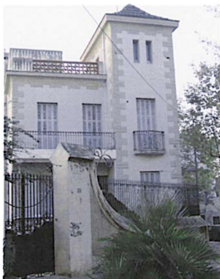
Entrada de Can Casas per el carrer de Barcelona i Martí Pujol

Durant el 1882 les dues cases dels números 48 i 50, senzilles i pageses, varen ser comprades per en Francesc - Xavier Casas i Planes -un indiano que havia tornat amb fortuna de les amèriques- i les va reconstruir en un sol i magnífic edifici remarcant les obertures exteriors amb unes línies clàssiques decadents, per ser la vivenda de tota la seva família. Al llindar la dècada de 1930 els hereus de la família posen la casa a lloguer i durant uns anys fou la seu d'una Clínica i els serveis complementaris a la mateixa.