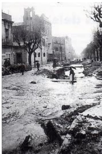
Av. Martí Pujol anys 50-60

Amb les pluges la cruïlla de la riera de Martí Pujol amb els carrers Barcelona i Rector es tornen en llocs de difícil pas pels vianants.